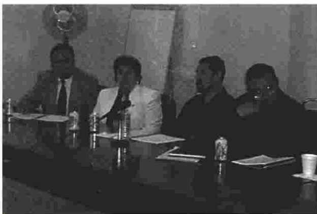
La Mesa de la Reforma Electoral fué llevada con seriedad y profesionalismo por parte de sus integrantes

• Equidad entre los Géneros: establece la obligación del Instituto Electoral del Estado de Zacatecas, partidos políticos y coaliciones, de implementar acciones que favorezcan la igualdad de oportunidades entre hombres y mujeres en el acceso a puestos de elección popular; se establece que en ningún caso se incluirá más del 70% de candidatos propietarios de un mismo género.